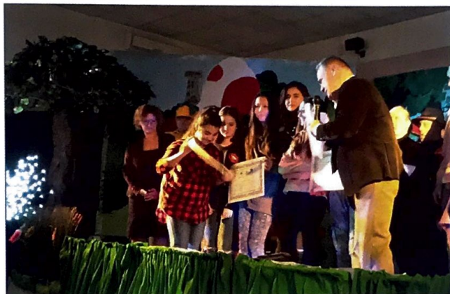
Un momento della premiazione