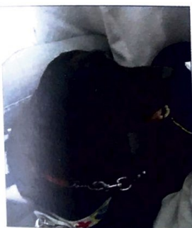
L'ospite di riguardo della Scuola di Limbiate

È stata, questo, un anno veramente eccezionale per gli obiettivi che si sono voluti raggiungere, in una vera e propria sfida alla ordinarietà, realizzando risultati eccellenti.