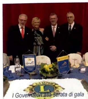
I Governatori alla serata di gala