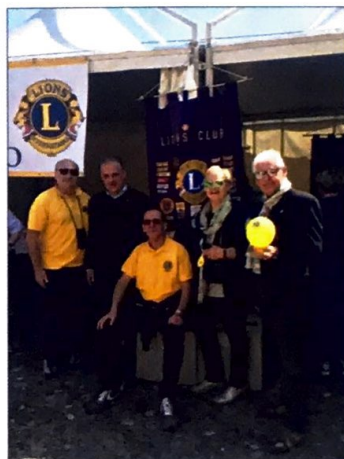
Alcuni dei lions partecipanti

A Stellata, antico borgo medioevale a ridosso del fiume Po e famoso per il suo Mercatino dell'antiquariato con oltre 250 espositori, abbiamo celebrato il LIONS DAY nell'anniversario della Giornata mondiale dei Lions, assieme ai Lion Clubs di Bondeno e Bondeno Terre del Panaro 2.0; la manifestazione, che ha preso il nome di "Prevenzione in Piazza", si è svolta in collaborazione anche con altre associazioni come Avis, Admo, Auser.