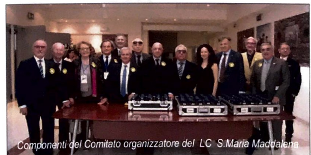
Componenti del Comitato organizzatore del LC S.Maria Maddalena