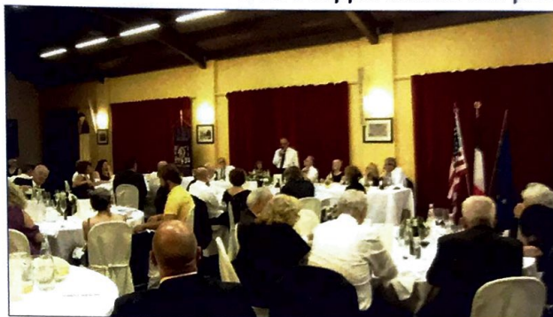
Un momento della serata