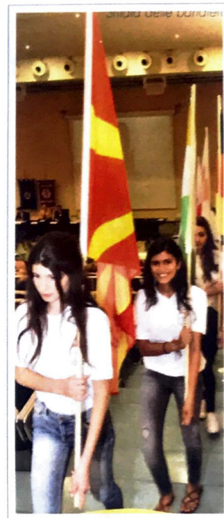
Apertura dei lavori con la sfilata delle bandiere