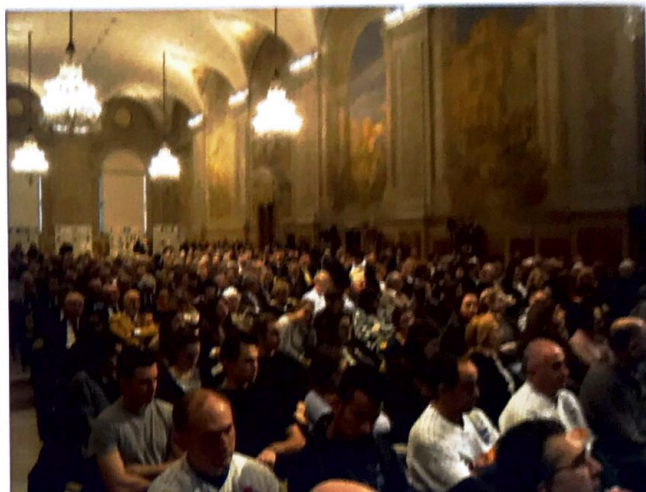
L'assemblea dei partecipanti

È seguito l'intervento del Governatore Giorgio Beltrami incentrato sullo stato del Distretto: Ha ricordato gli obiettivi da lui prefissati all'inizio del mandato: incontro e ascolto dei club e dei soci, migliore programmazione delle attività, maggiore presenza sul territorio, focus sui service del Centenario, e continua collaborazione tra Lions e Leo. Ha ribadito che dobbiamo concentrarci su poche cose, rilevanti anzitutto per le persone e le comunità, ma anche per i media per avere più visibilità. Segnala che in relazione al terremoto il Distretto ha raccolto oltre 60.000 euro, segno di solidarietà e vicinanza alle località colpite. Guardando al futuro, il Governatore ha posto due